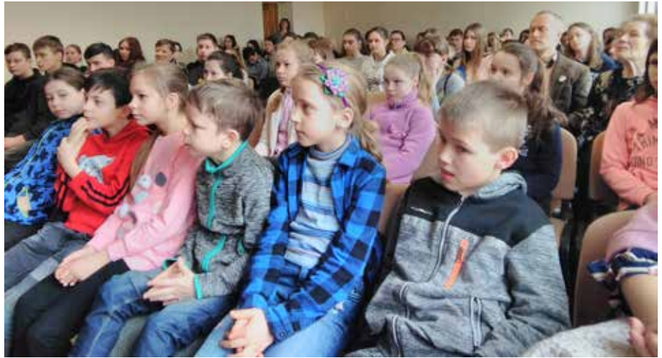
Bendras salės vaizdas