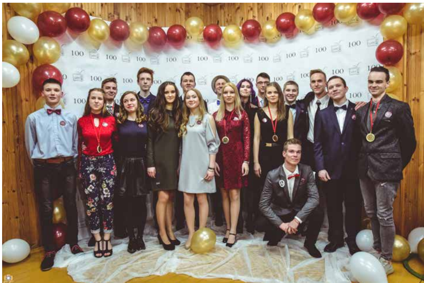
III g klasės mokiniai su abiturientais