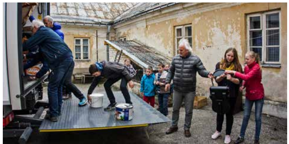
Norvegų labdara Užpalių bendruomenei

Užpalių Lions klubas buvo įkurtas 2001 metais. Jo atsiradimą inicijavo bičiuliai iš Norvegijos. Ir taip, mūsų klubas tapo tarptautiniu Lions klubu, didžiausios ir reprezentyviausios asociacijos nariu. Klubo tikslas yra tarnauti žmonėms, padėti jiems sunkiais gyvenimo momentais. Klubas Užpalius garsina savo prasminga labdaringa veikla, nes teikiama parama yra pasiekusi Vyžuonų, Saldutiškio, Kuktiškių seniūnijas, Utenos ligoninę ir polikliniką, Šv. Klaros palaikomojo gydymo ir slaugos ligoninę ir ugdymo institucijas. Eilę metų, šv. Kalėdų proga, nuperkamos