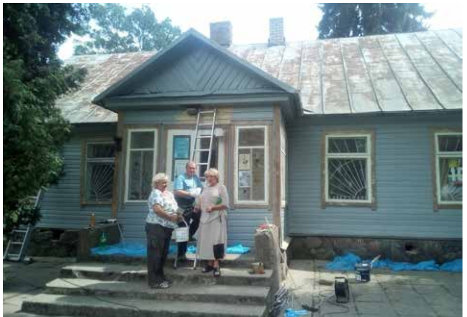
Dienos centro namo renovacija