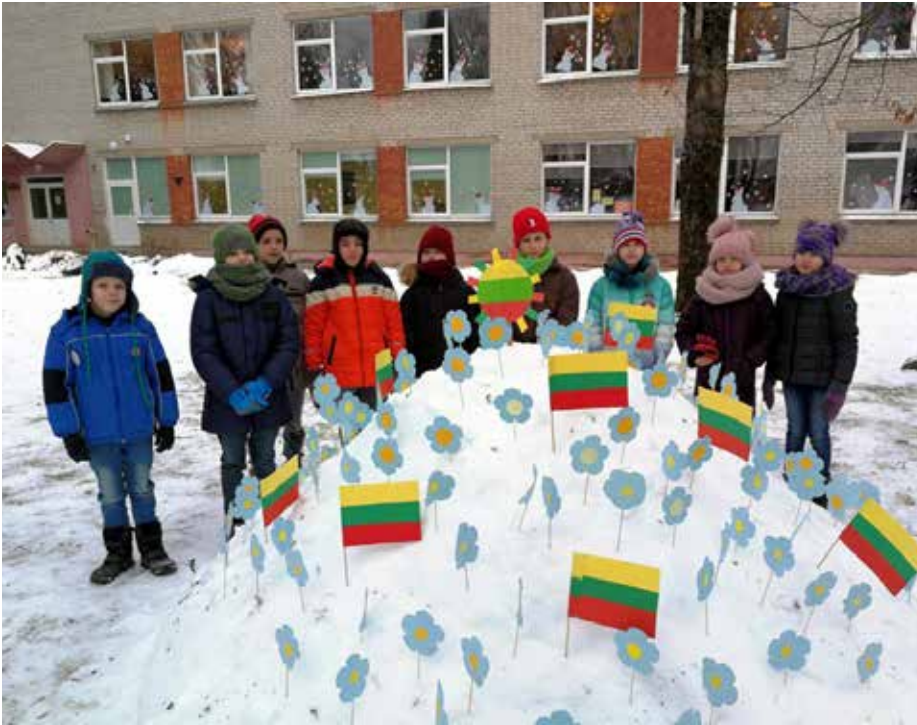
Užpalių g. pradinė klasių mokiniai

ja. Saugioje ir šiuolaikiškoje ugdymo aplinkoje teikiamas ikimokyklinis, priešmokyklinis, pradinis, pagrindinis, vidurinis išsilavinimas. Užpalių gimnazijos bendruomenė sutaria laikytis šių vertybių: atsakomybė, kūrybiškumas, bendradarbiavimas, kiekvieno tobulėjimas. Jei suskaičiuotume mokinius visose pakopose, jų - 156, drauge su jais - 24 mokytojai ir 27 aplinkos darbuotojai.