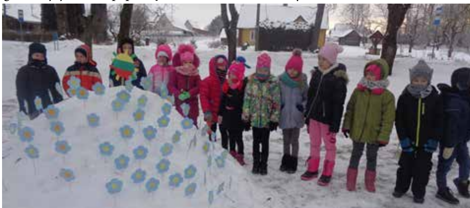
Pradinė klasių mokiniai prie supilto kalnelio Sausio 13 d.