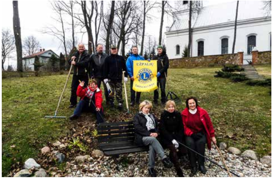
Tvarkome aplinką prie Vyžuonų bažnyčios