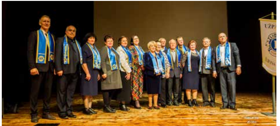
Užpalių Lions klubo nariai