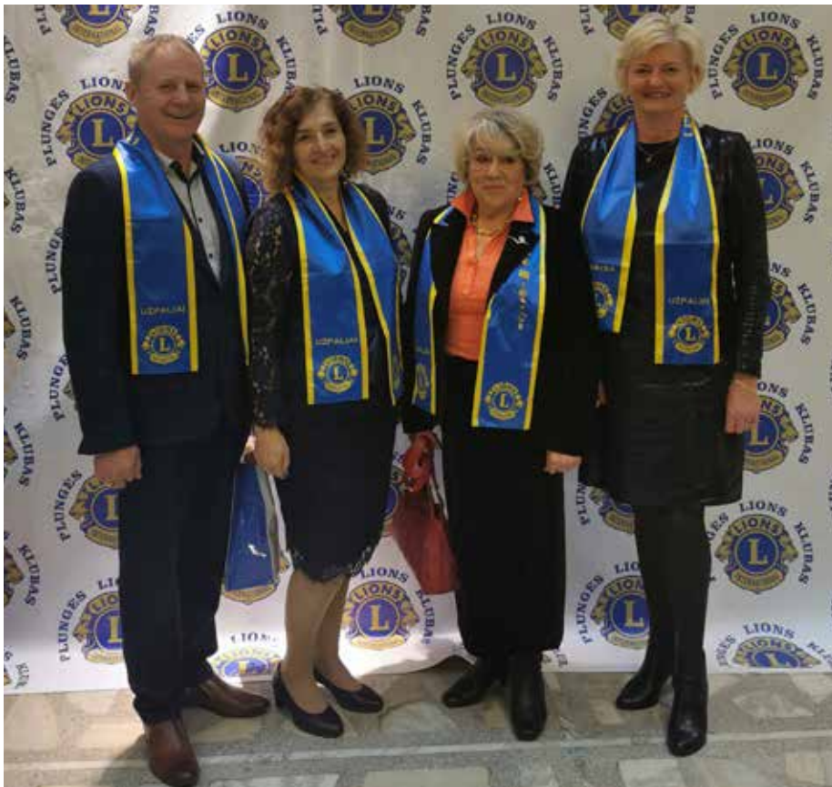
Lions klubo įkūrėja