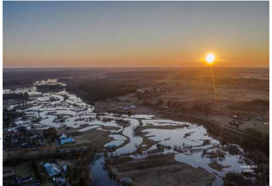
Nuotarikos kūr. Jono Bučelio

lenktynių, kai pasibaigus Prisikėlimo pamaldoms Užpalių parapijos ūkininkai bėgte išpuolę iš bažnyčios, šokdavo į vežimus ir ragindami ristūnus skubėjo kuo greičiau parvežti džiaugsmo žinių namiškiams – nė atkurti nereikėjo: už-